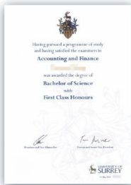
萨里大学 学士学位证书样本

*中方毕业证、学位证不存在“中外合作办学专业”“萨里国际学院”等单独标注的情况；外方学位证没有“在中国学习”等字样，萨里国际学院的毕业和学位证书与两校普通专业的证书完全一致。