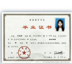
东北财经大学 本科毕业证书样本

学院的中外合作办学专业为“4+0”双学位模式，实行两校“双学籍”注册，学生共享两校丰富而优质的线上线下学习资源。 学生在东北财经大学主校区完成学业 ，并修满培养方案要求的学分，符合中外双方毕业与学位授予条件，可获得 东北财经大学颁发的本科毕业证书、学士学位证书和英国萨里大学颁发的学士学位证书 。