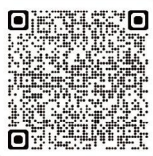
扫码了解 更多优秀学子故事

学院现有十五届毕业生共五千五百余人，毕业生去向落实率稳定在90%以上。其中，出国（境）深造比例约50%，超过90%的深造学生进入QS世界前100高校，部分优秀学子录取院校包括牛津大学、剑桥大学、哈佛大学、帝国理工学院、新加坡国立大学、伦敦大学学院等世界知名学府。国内升学比例超过16%，其中近三年推免率稳定在10%左右。在国内升学的学生中，约半数赴“双一流”及以上层次高校深造，部分优秀学子录取至北京大学、清华大学和中国人民大学等知名院校。直接就业比例接近15%，毕业生广泛就职于六大国有银行、国泰君安、中金公司、摩根士丹利、华为、腾讯、阿里巴巴、宝洁、四大会计师事务所等世界500强及知名企业，以及外交部、中国证监会、中央广播电视总台等国家行政机关和事业单位。