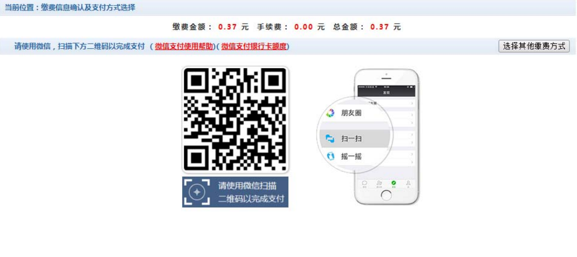
图 3.4-5 微信支付