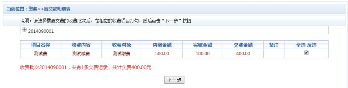
图 3.5-1 其他零星欠费

点击导航栏的“其他缴费”按钮，进入其他缴费显示和选择页面，如图 3.5-1 所示。