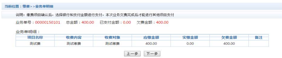
图 3.5-2 业务单费用确认

C. 确认缴费信息，选择缴费金额和缴费方式。如图 3.5-3 所示。点击“业务单明细查看”可查询该业务单支付情况。