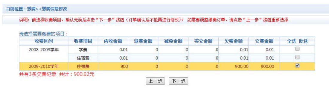
图 3.4-2 缴费项目选择