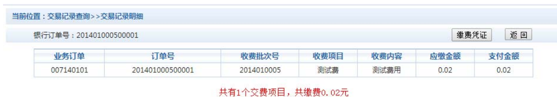
图 3.6-2 交易记录明细

若是其他缴费的订单，可以点击缴费凭证，查看和打印缴费凭证。如图 3.6-3 所示