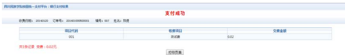
图 3.6-3 缴费凭证