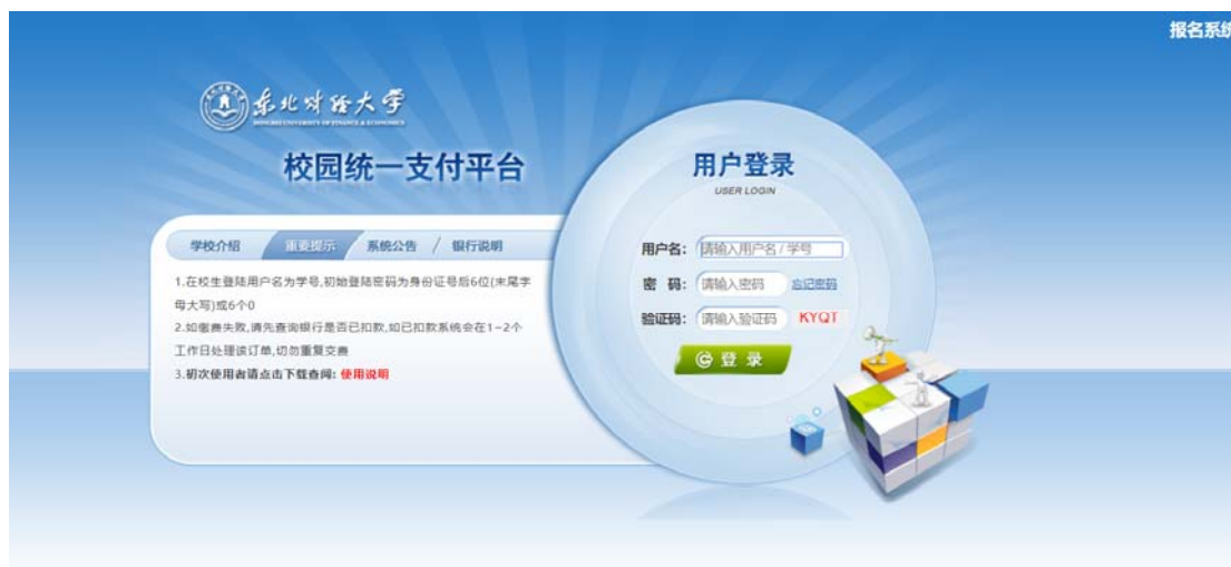
图 3.1-1 统一支付平台登陆界面

在浏览器地址栏输入 http://pay.dufe.edu.cn/ ，如图 3.1-1 所示。登陆之后显示个人应缴费信息，如图 3.1-2 所示。