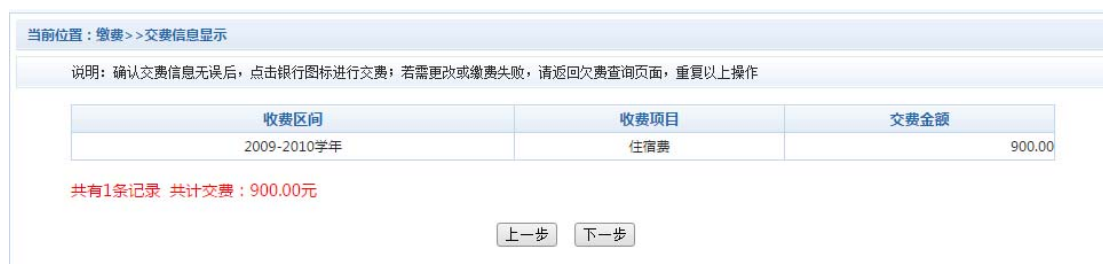
图 3.4-3 缴费方式选择