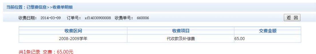
图 3.7.2 已缴费明细