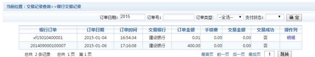
图 3.6-1 交易记录查询

点击导航栏的“交易记录查询”按钮，可以查询具体的银行交易记录。如图 3.6-1 所示。