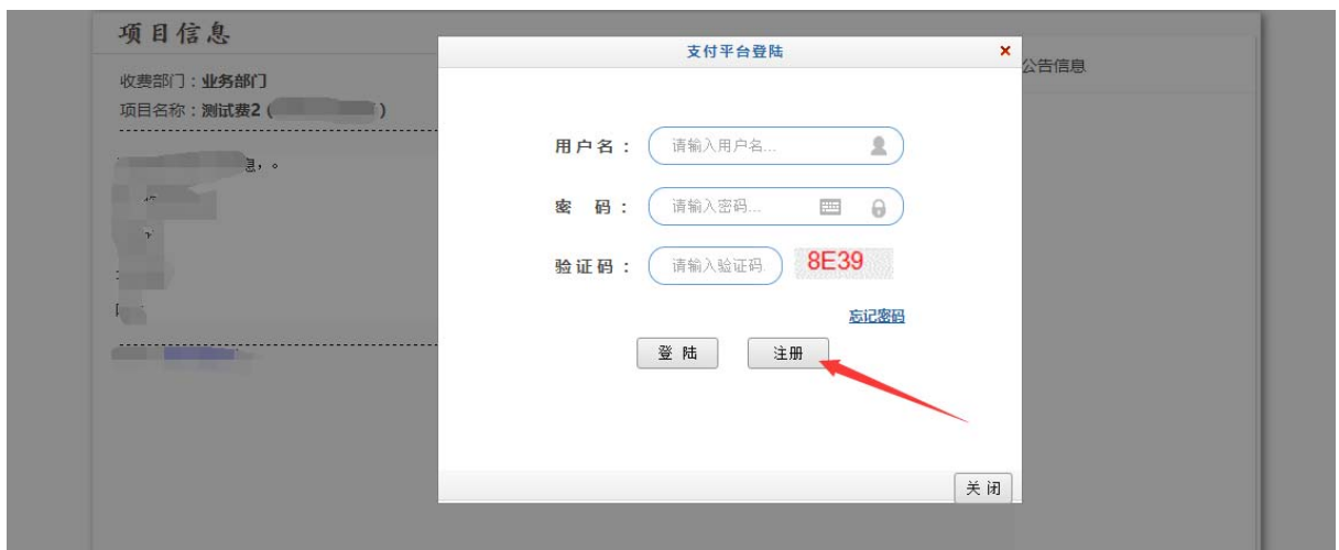
点击注册按钮进行报名信息填写