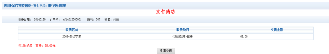
图 3.4-8 支付成功